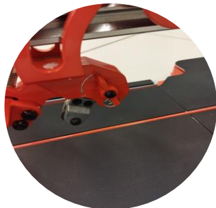
▲刃の2段階高さ調整ダイヤル