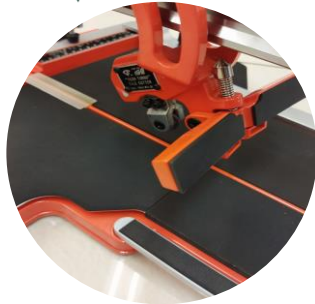
▲切線を入れる時は押さえを磁石で固定