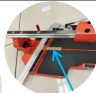
▲かるわりホルダー